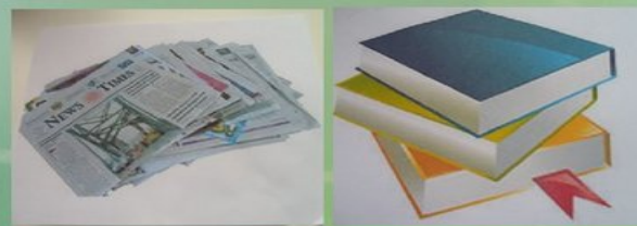
Узнать информацию из книг и газет