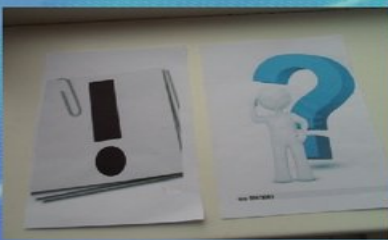
Подумать и вспомнить