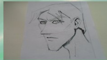
Спросить у другого человека