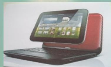
Найти информацию в интернете